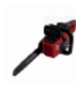
HHC 36 BXB