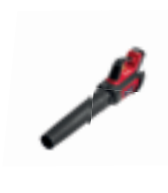
HHB 36 BXB