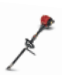
UMC 425 E