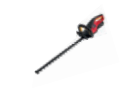
HHH 36 BXB